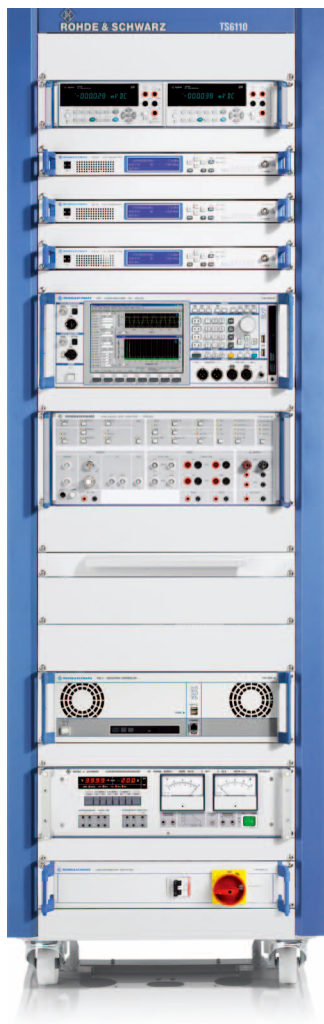
配有 3 台 R&S® SFE100 信号源的 典型 R&S® TS6110 系统配置。